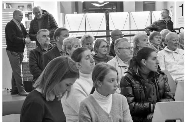
Svečių klausėsi beveik pilna bibliotekos salė.

„Jeigu žmonių santykiai yra iki tiek komplikuojami, kad net lendama į jų lovą, kas jau yra intymumo viršūnė. Niekas niekada nelįsdavo. Sovietai neigė, kad lovoje apskritai kas nors vyksta. Bet ir tai nelabai lindo. O dabar demokratijos viršūnėje