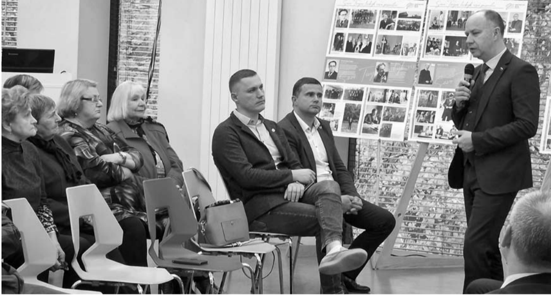
Pasak buvusio Sveikatos apsaugos ministro Aurelijaus Verygos, dėl šios valdžios politikos žmonėms darosi paprasčiau gyventi po vieną.