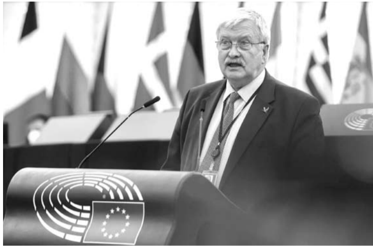
Europarlamentaras Bronis Ropė.

Finansų ministerija teigė, kad nekilnojamojo turto mokestį reikia įvesti dėl to, kad valstybės pajamos iš tokio turto apmokestinimo iki šios dienos sudaro tik 0,3 proc. BVP, o kitose Europos