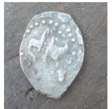
Kasinėjant Anykščių dvarvietę, aptikti du XIV amžiaus radiniai: moneta ir šukė.